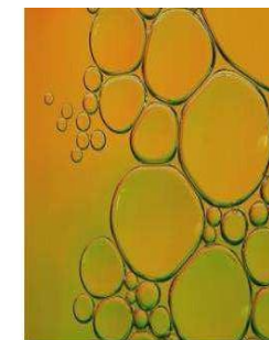
Basic Materials & Chemicals