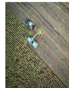
Agro, Farming, Forestry