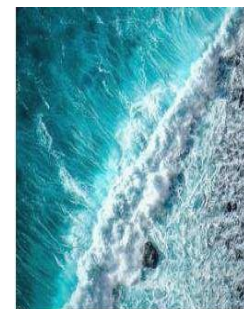
Blueeconomy & Fishery