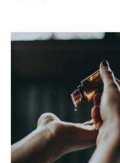
Home & Personal Care